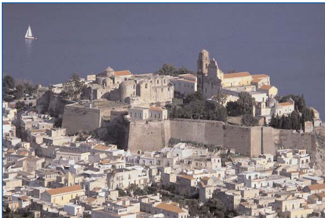
Il Castello di Lipari.